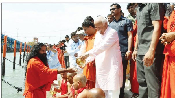
कहा कि आज से लगभग 10 वर्ष पहले का वातावरण ऐसा नहीं था। मन में चिंता होती थी किन्तु अब स्थितियां बदल चुकी हैं। यहां युवा सन्यासियों को देखकर सारी चिंताओं को विराम मिल गया है। एक साथ इतनी बड़ी संख्या में सन्यासियों को देश सेवा में समर्पित करना रामराज्य की स्थापना, ऋषि परम्परा और भावी आध्यात्मिक

टीम एक्शन इंडिया/हरिद्वार राष्ट्रीय स्वयंसेवक संघ के सरसंघचालक डा.मोहन भागवत ने कहा कि सबसे बड़ा त्याग नव सन्यासियों के माता-पिता का है, जिन्होंने अपने बच्चे को पाल-पोसकर देश, धर्म, संस्कृति और मानवता के लिए समर्पित कर दिया है। संघचालक डा.भागवत यह विचार गुरुवार को योगत्रयि स्वामी रामदेव के 29वें सन्यास दिवस पर हर की पौड़ी वीआईपी घाट पर शताधिक विद्वान और विदुषी सन्यासियों को राष्ट्र को समर्पित करने के अवसर पर व्यक्त किया। सरसंघचालक डा. मोहन भागवत ने