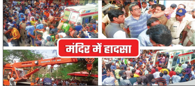
मंदिर में हादसा

टीएम एक्शन इंडिया/इंदौर रामनवमी के मौके पर इंदौर में एक बड़ा हादसा हो गया है। श्री बेलेश्वर महादेव झुलेलाल मंदिर में छत ढहने से कुछ श्रद्धालु बावड़ी में गिर गए, खबर लिखे जाने तक बचाव अभियान जारी था। बताया जा रहा है कि अधिकारियों को इस बावड़ी की कोई जानकारी नहीं थी, हादसे के बाद उन्हें इसका पता चला है। इस हादसे में अब तक 19 श्रद्धालुओं को बाहर निकाला जा चुका है। बताया जा रहा है कि 13 लोगों की मौत हो गई है।