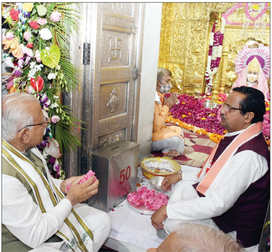
हरियाणा के मुख्यमंत्री मनोहर लाल ने गुरुवार को रामनवमी के अवसर पर पंचकूला में ऐतिहासिक श्री माता मनसा देवी मंदिर में महामाई के दर्शन कर आशीर्वाद लिया। इस दौरान उन्होंने प्रदेशवासियों की खुशहाली व सुख समृद्धि के लिए कामना की।

रुपये की 22 परियोजनाओं का शिलान्यास किया गया। इसी प्रकार, हिसार के सभी विधानसभा क्षेत्रों में 215.57 किलोमीटर की परियोजनाओं पर कुल 17114.61 लाख रुपये की राशि खर्च की जाएगी। इन परियोजनाओं के शिलान्यास के अतिरिक्त महाराजा अग्रसेन हवाई अड्डे के लिए आपातकालीन रास्ते तथा पैरीमीटर सड़क के निर्माण तथा परिचालन क्षेत्र में विस्फोटक निपटण क्षेत्र का निर्माण (कूलिंग ऑफ पिट) और आरसीसी सुरक्षा वॉच टॉवर के निर्माण कार्यों पर भी 2627.88 लाख रुपये की धनराशि खर्च की जाएगी।